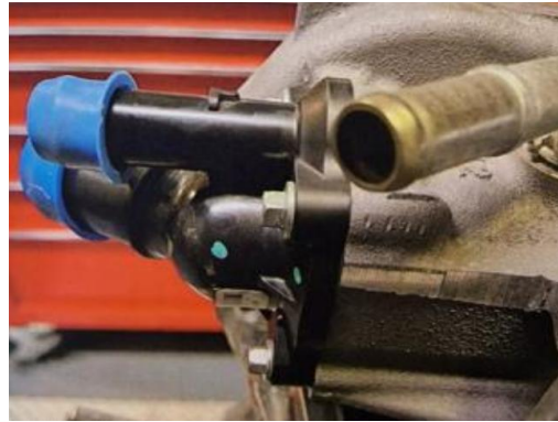
Figura 1 – Detalhe do tubo de refrigeração a tamponar.

7.3.1.1 Termostato: A utilização e instalação de termostato no circuito de refrigeração é livre. É permitido bloquear ou suprimir o tubo, de borracha, que liga a peça plástica da saída de água da cabeça ao tubo metálico na parte superior do alojamento do termostato (observar a Figura 1).