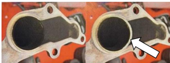
Figura 2 – Coletor de escape nº4 original (à esquerda) e modificada com adição de material (à direita).

7.3.1.4 Coletor de Escape / Cabeça do Motor: é permitido preencher/completar o remate do coletor de escape nº4 (figura 2) por adição de material ou tamponar na cabeça do motor (figura 3), na mesma zona com o mesmo fim de bloquear a passagem de gases de escape para o furo instalado nessa zona da cabeça, facilitando o escoamento dos gases para o coletor e a redução da temperatura nessa zona.