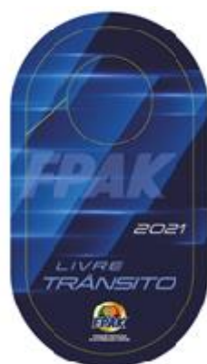
Credencial a) Direção